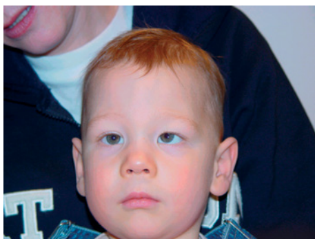
Abb.3 : Frühkindliches Schielen mit Höherstand des linken Auges

Schielen hat viele Ursachen. Die Tatsache, dass Schielen in manchen Familien gehäuft auftritt, lässt auf eine erbliche Veranlagung schließen. Vor allem, wenn ein Elternteil schielt oder wegen Schielen behandelt wurde, sollte das Kind schon im Alter von sechs bis zwölf Monaten dem Augenarzt vorgestellt werden. Häufig ist allerdings nur ein Mitglied der Familie vom Schielen betroffen, Jungen und Mädchen gleichermaßen. Auch Risikofaktoren, die während der Schwangerschaft oder Geburt auftreten, können Schielen bewirken.