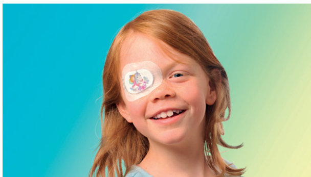
Abb. 5: Abklebebehandlung

Führen Brille und Abdeckung nicht zu einer Besserung der Sehschärfe, weil die Amblyopiebehandlung nicht rechtzeitig beginnen konnte, kann bisweilen eine Schulungsbehandlung durch den Augenarzt oder die Orthoptistin weiterhelfen. Neuere Therapiemethoden arbeiten hier auch mit computergestützter Amblyopie-Schulung. Das Kind wird in der Sehschule (Orthoptik) in die Übungen eingewiesen, die es dann täglich zu Hause fortsetzen soll.